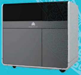
マルチジェット型3Dプリンタ ProJet MJP2500Plus