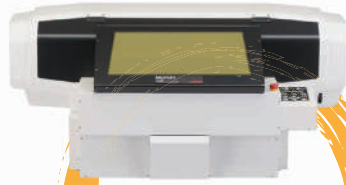
UVインクジェットプリンタ VJ-426UF