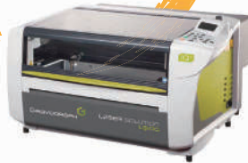
グラボテック社 レーザー加工機 LS-100