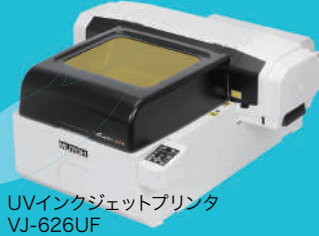
UVインクジェットプリンタ VJ-626UF