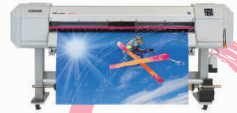
ULVAインク搭載高性能低コスト 定番インクジェットプリンタ VJシリーズ