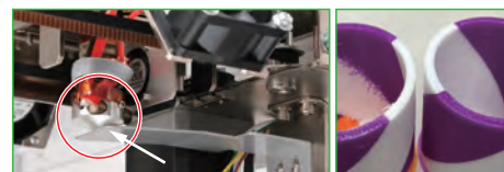
待機中のヘッドノズル(赤い円)を塞ぐシャッター(白矢印)の 働きにより、つなぎ目のゴミの付着が低減している(写真右)。