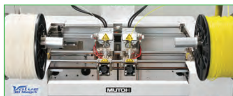
ボディ上部に搭載されたMUTOH自社開発 高速デュアルヘッド。