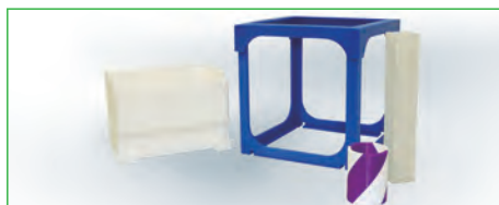
ブルーの造形物サンプルが、ほぼ300×300×300mmの大きさ。

パーソナル3Dプリンター最大クラスの300× 300×300mmの造形エリアと、デュアルヘッド 搭載で別色のフィラメントを使用した2色造形 が行えます(フィラメント径は1.75mm)。 ABS、PLAに加えサポート材としてPVAも利用 可能です。