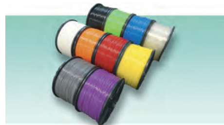
● 豊富なカラーバリエーションのフィラメント

安全に関するご注意 商品を安全にお使いいただくため、ご使用前に必ず「取扱説明書」をよくお読みください。