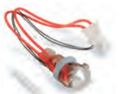
自社開発ヒーターヘッド コンポーネント

MF-2200Dは、2つのヘッドを個別にコントロー ル。一つのヘッドが作業を終了すると造形エリア から離れて待機するデュアルキャリッジ方式を採 用。自社開発のヘッドが、高い熱容量を安定的 に維持出来ることと、軽 量化による軸移動の高 速化を加え、造形スピー ドを約1.2倍(当社比)ま で高めました。